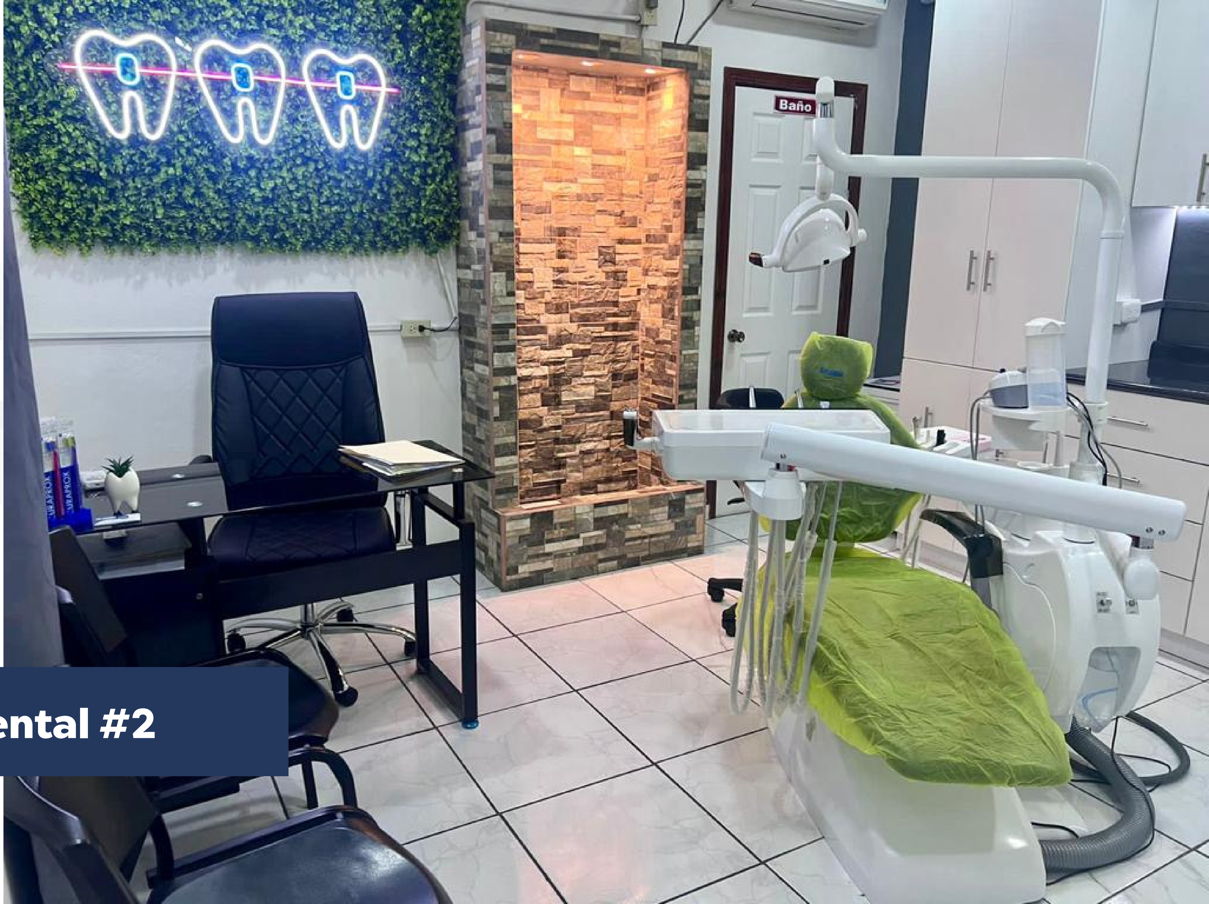
Clínica dental #2