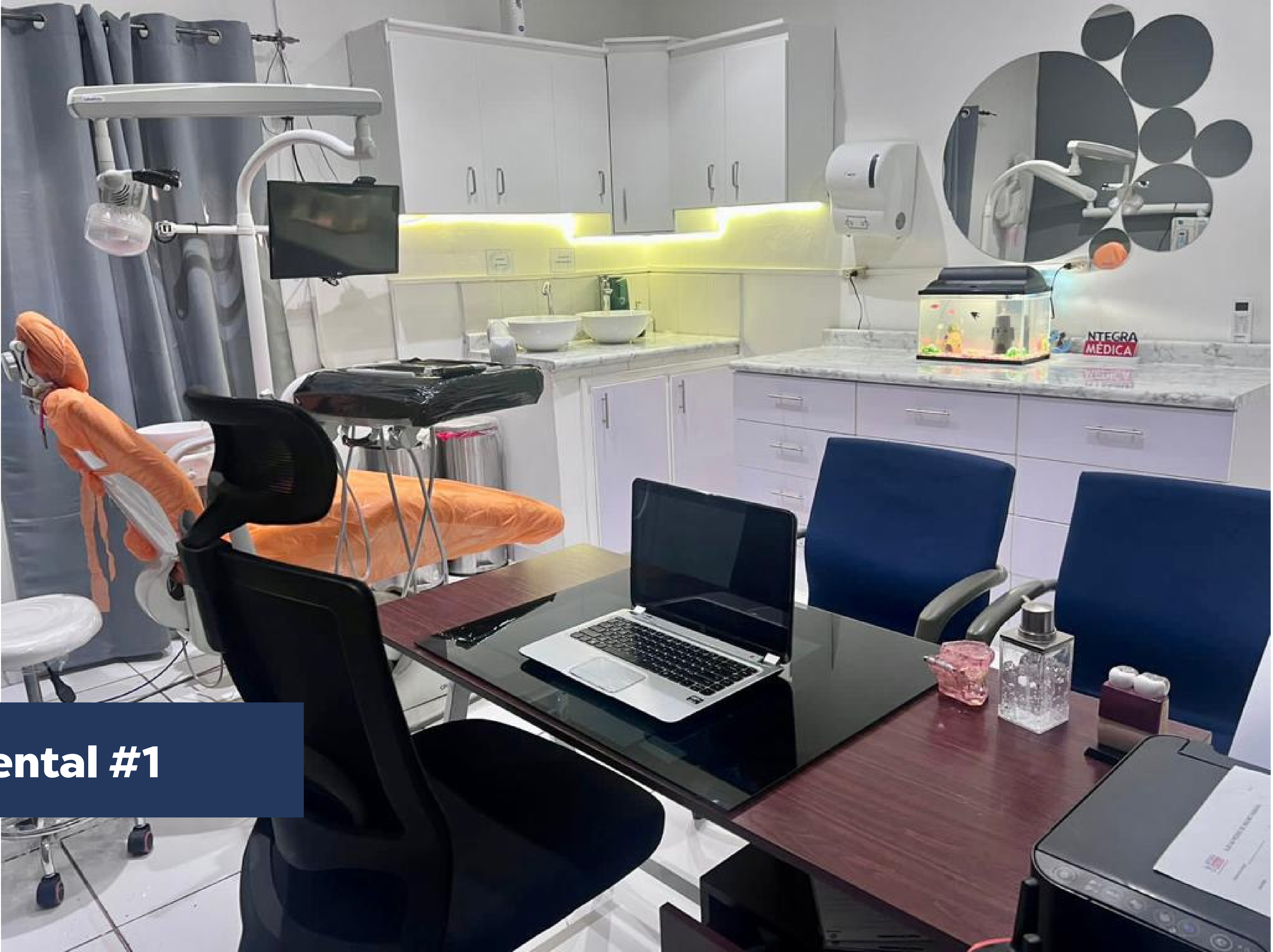
Clínica dental #1